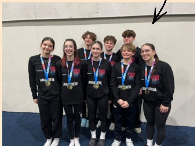
Retour sur les 9 médailles du trampoline aux Jeux du Québec

L'article final disponible ici Bonne lecture !